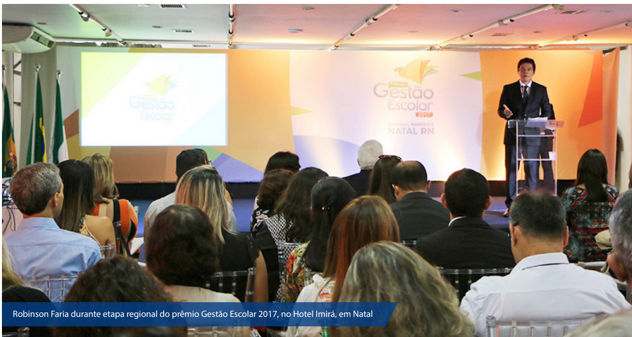
Robinson Faria durante etapa regional do prêmio Gestão Escolar 2017, no Hotel Imirá, em Natal

Governador Robinson Faria prestigiou o evento e destacou que o prêmio é um estímulo para professores e alunos buscarem novos caminhos para a educação