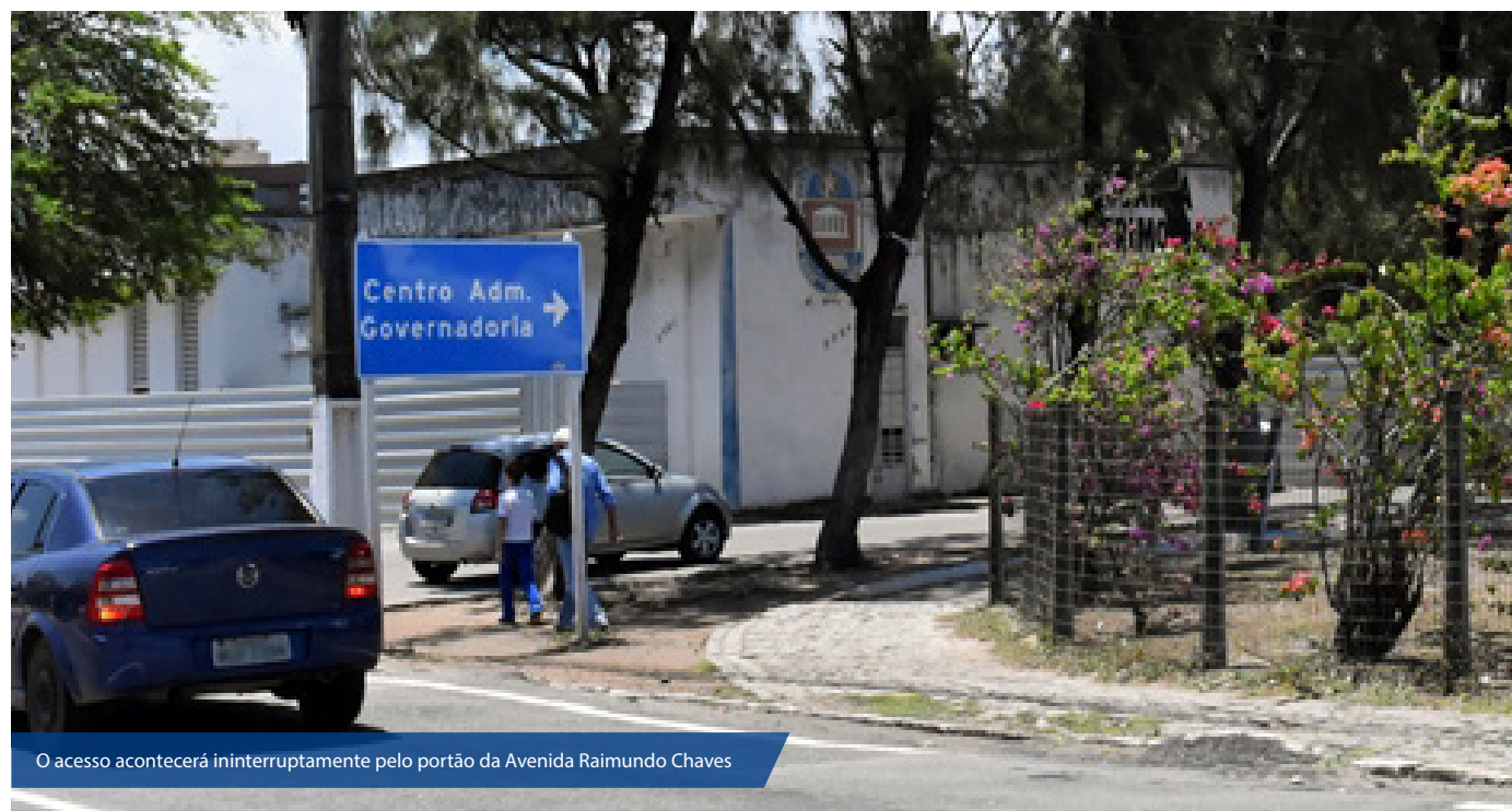
O acesso acontecerá ininterruptamente pelo portão da Avenida Raimundo Chaves

As alterações são apenas para veículos, e pedestres continuam tendo acesso pela entrada à margem da BR 101 ou pelo portão posicionado na Avenida Raimundo Chaves. A obra na entrada principal do Centro Administrativo pretende melhorar a identificação, segurança e acessibilidade das comunidades interna e externa e deve ser concluída em cinco meses.