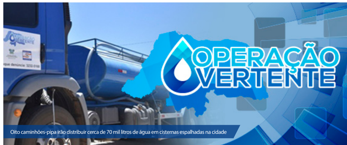
Oito caminhões-pipa irão distribuir cerca de 70 mil litros de água em cisternas espalhadas na cidade