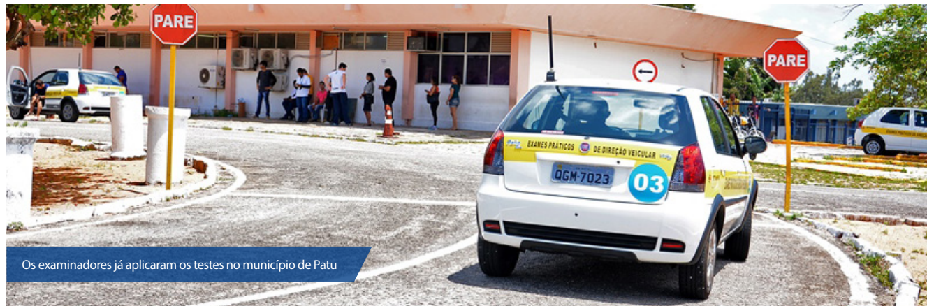
Os examinadores já aplicaram os testes no município de Patu