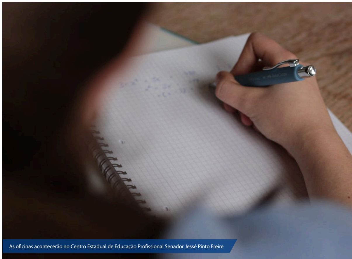
As oficinas acontecerão no Centro Estadual de Educação Profissional Senador Jessé Pinto Freire

As oficinas, que fazem parte das ações da Subcoordenadoria de Ensino Médio, vão acontecer no Centro Estadual de Educação Profissional Senador Jessé Pinto Freire (CE-NEP), localizado no bairro de Petrópolis, em Natal/RN.